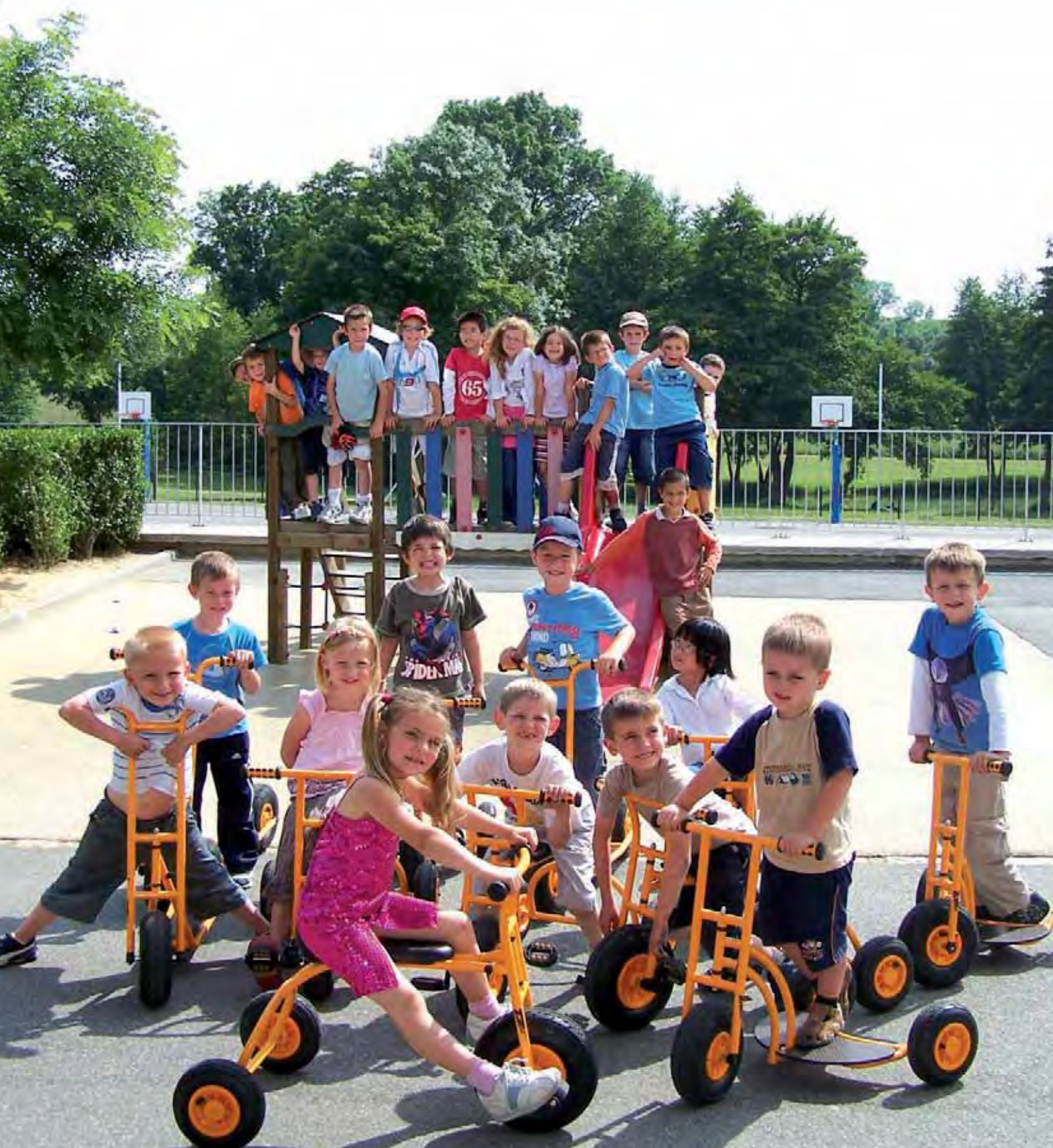
Les nouvelles trottinettes pour les enfants-du groupe scolaire financées par la Municipalité