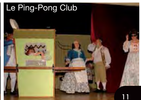
Le Ping-Pong Club