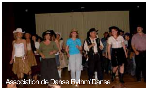
Association de Danse Rythm'Danse