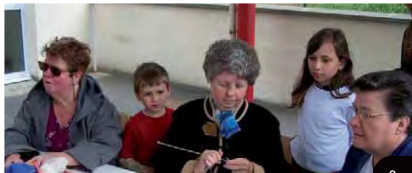
Le stand intergénérationnel