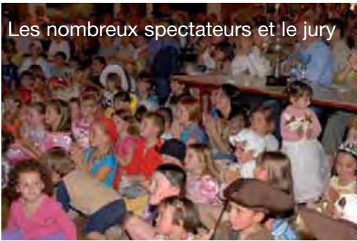
Les nombreux spectateurs et le jury