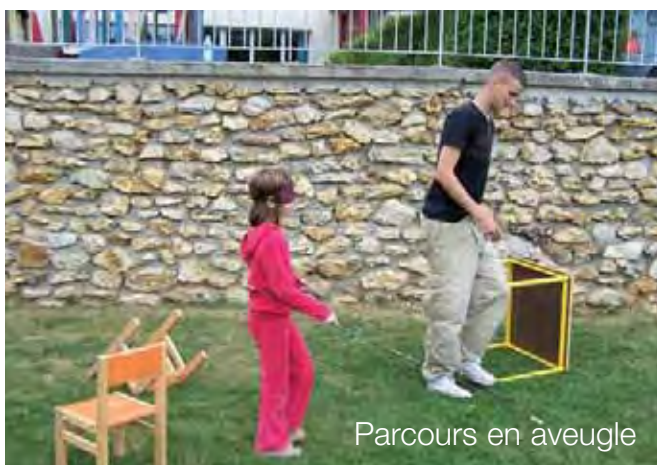
Parcours en aveugle