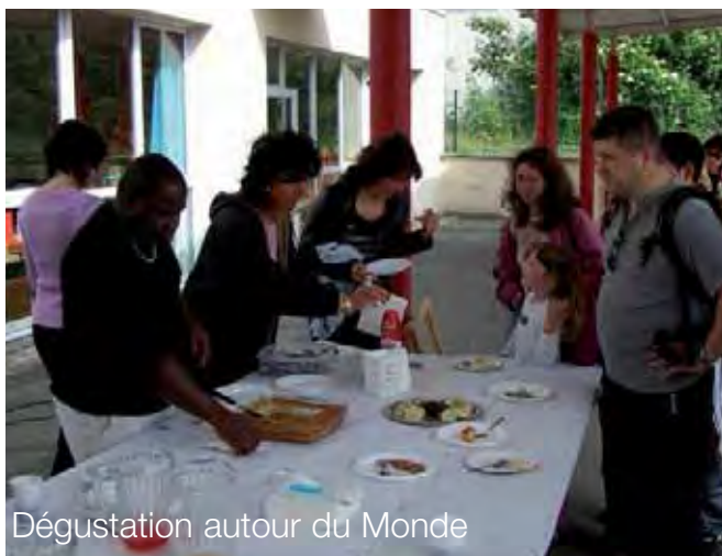
Dégustation autour du Monde