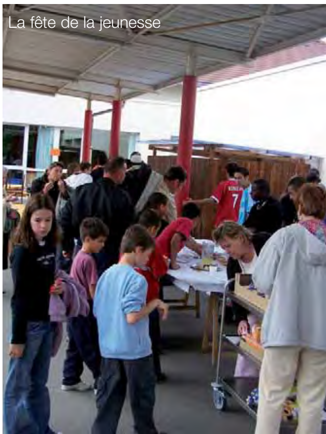
La fête de la jeunesse

La troisième édition de la Fête de la Jeunesse s'est déroulée le 12 mai dernier au Groupe Scolaire de la Taffarette . Proposée et organisée par le service Jeunesse, cette manifestation avait pour thème "La Différence".