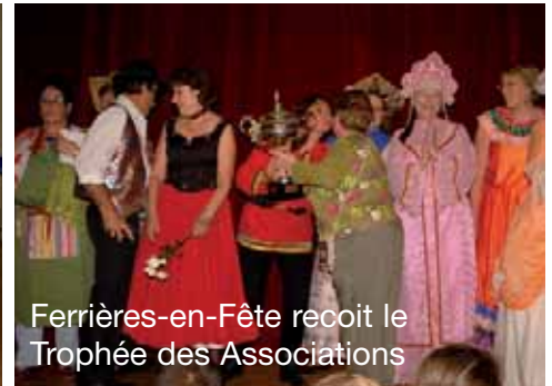
Ferrières-en-Fête reçoit le Trophée des Associations

C'est par une belle journée ensoleillée que s'est déroulé le carnaval du village. Le 2 juin dernier , les habitants ont profité d'une pleine journée de festivités associant spectacles et animations dans la salle des fêtes.