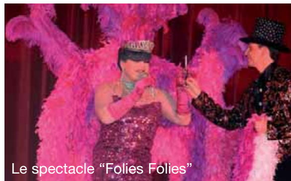
Le spectacle "Folies Folies"