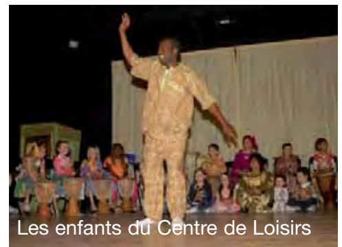
Les enfants du Centre de Loisirs