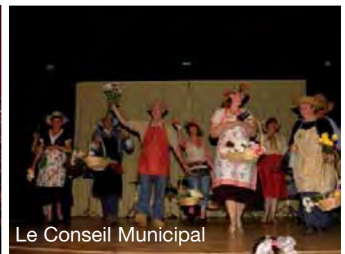
Le Conseil Municipal